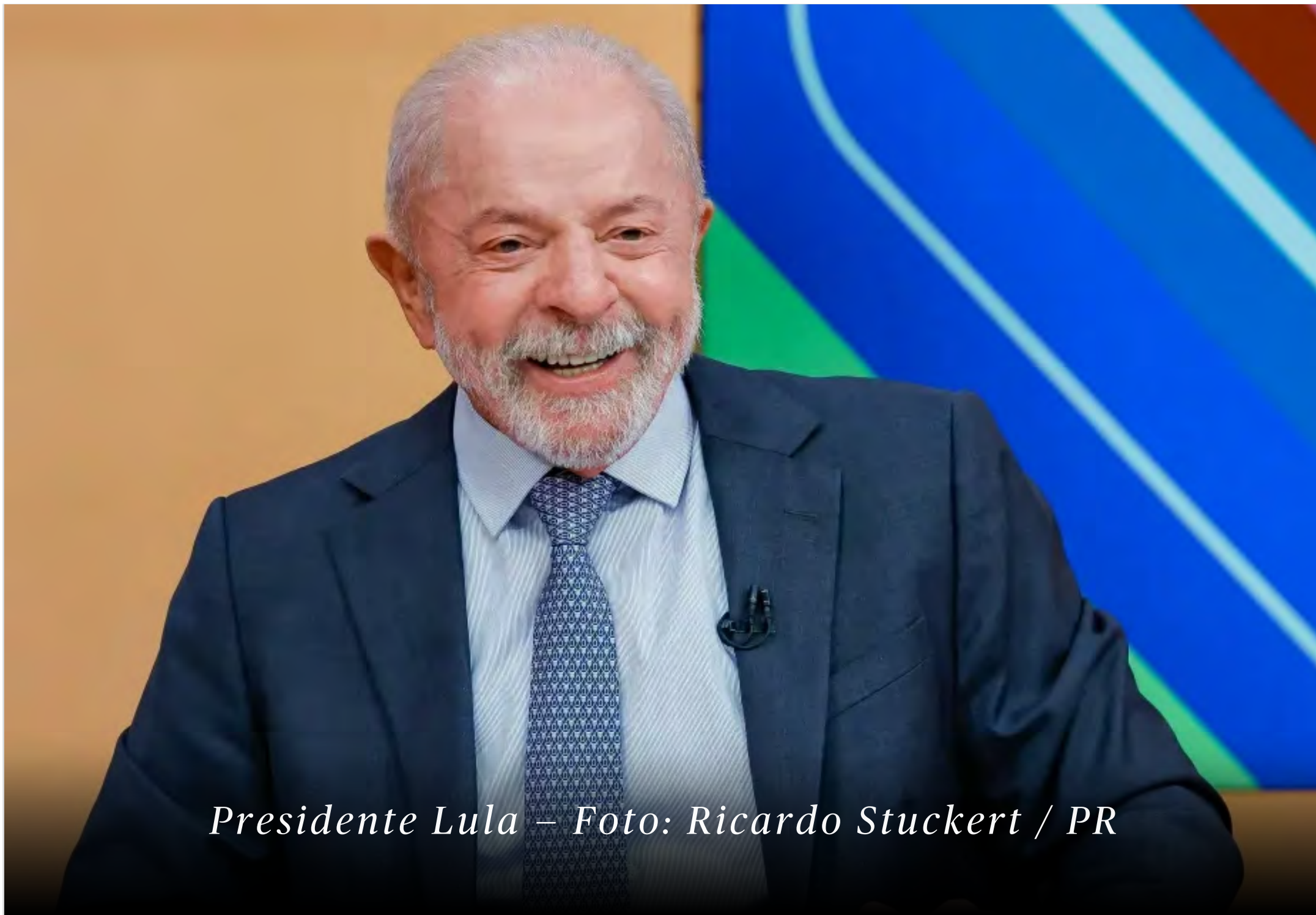
Presidente Lula

O presidente Luiz Inácio Lula da Silva (PT) iniciou uma nova etapa na construção do programa de governo que servirá de base para a disputa presidencial de 2026. Por meio do Plano Participativo pelo Brasil, pelos Brasileiros, partidos aliados, fundações e representantes da sociedade civil elaboram propostas para um eventual mandato entre 2027 e 2030. Um dos principais diferenciais da iniciativa é a participação popular. Até 30 de junho, qualquer cidadão pode acessar a plataforma digital do Plano Participativo, cadastrar-se e enviar sugestões sobre áreas como economia, saúde, educação, segurança pública, meio ambiente e inovação tecnológica.