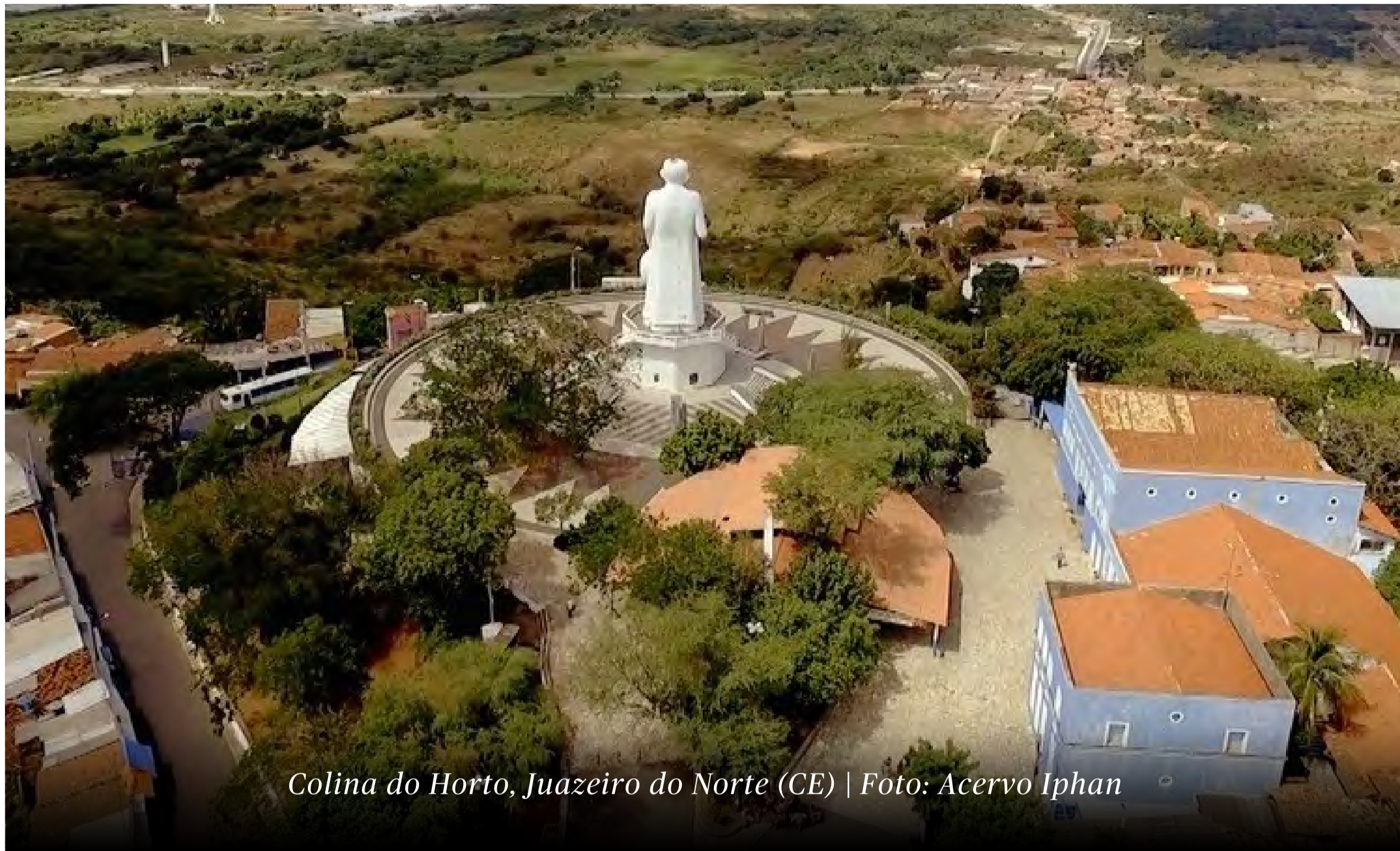
Colina do Horto, Juazeiro do Norte (CE)