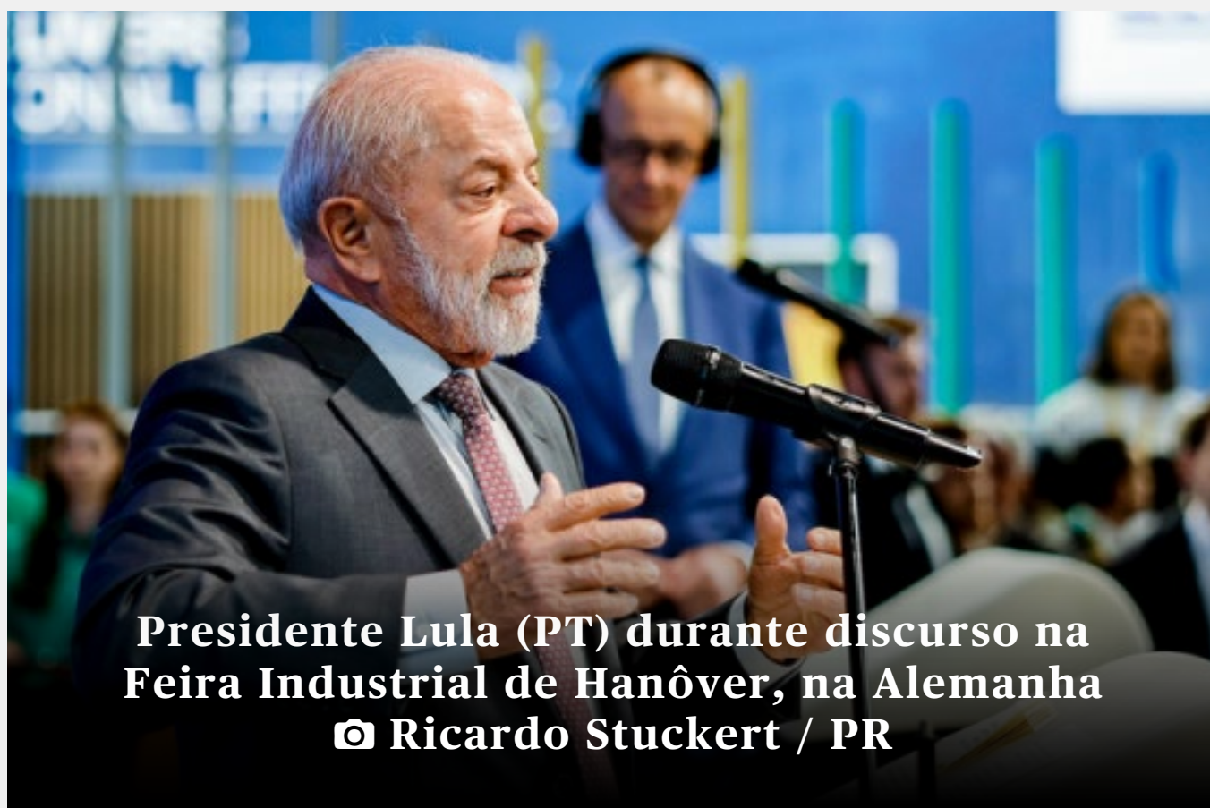
Presidente Lula (PT) durante discurso na Feira Industrial de Hanôver, na Alemanha

N a abertura de uma das maiores feiras industriais do planeta, o presidente Lula destacou a importância de estreitar relações entre Brasil e Europa, com ênfase em energia limpa, inovação tecnológica e neointustrialização. Ele também criticou restrições aos biocombustíveis e buscou posicionar o país como parceiro estratégico na transição energética global. O discurso articula temas como geopolítica, economia, clima e trabalho, evidenciando a estratégia do governo de transformar as agendas ambiental e industrial em ativos políticos, tanto no cenário interno quanto internacional.