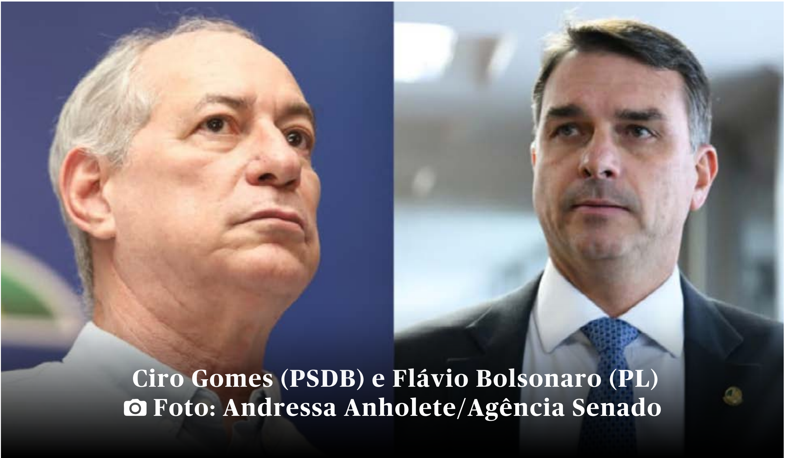
Ciro Gomes (PSDB) e Flávio Bolsonaro (PL)