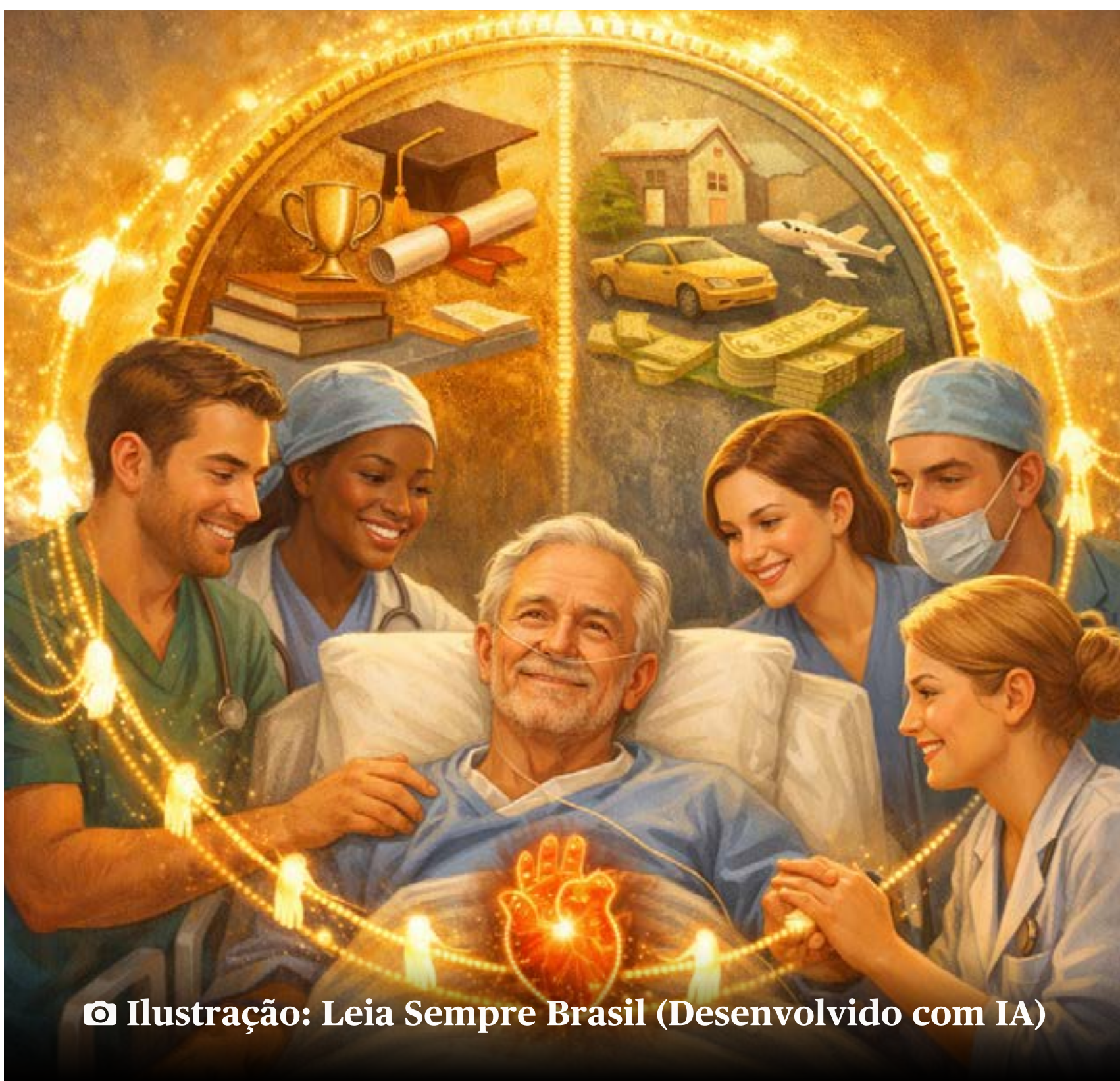
Ilustração: Leia Sempre Brasil (Desenvolvido com IA)

Pouco depois, ao ser levado para a sala de cirurgia, outro rosto conhecido