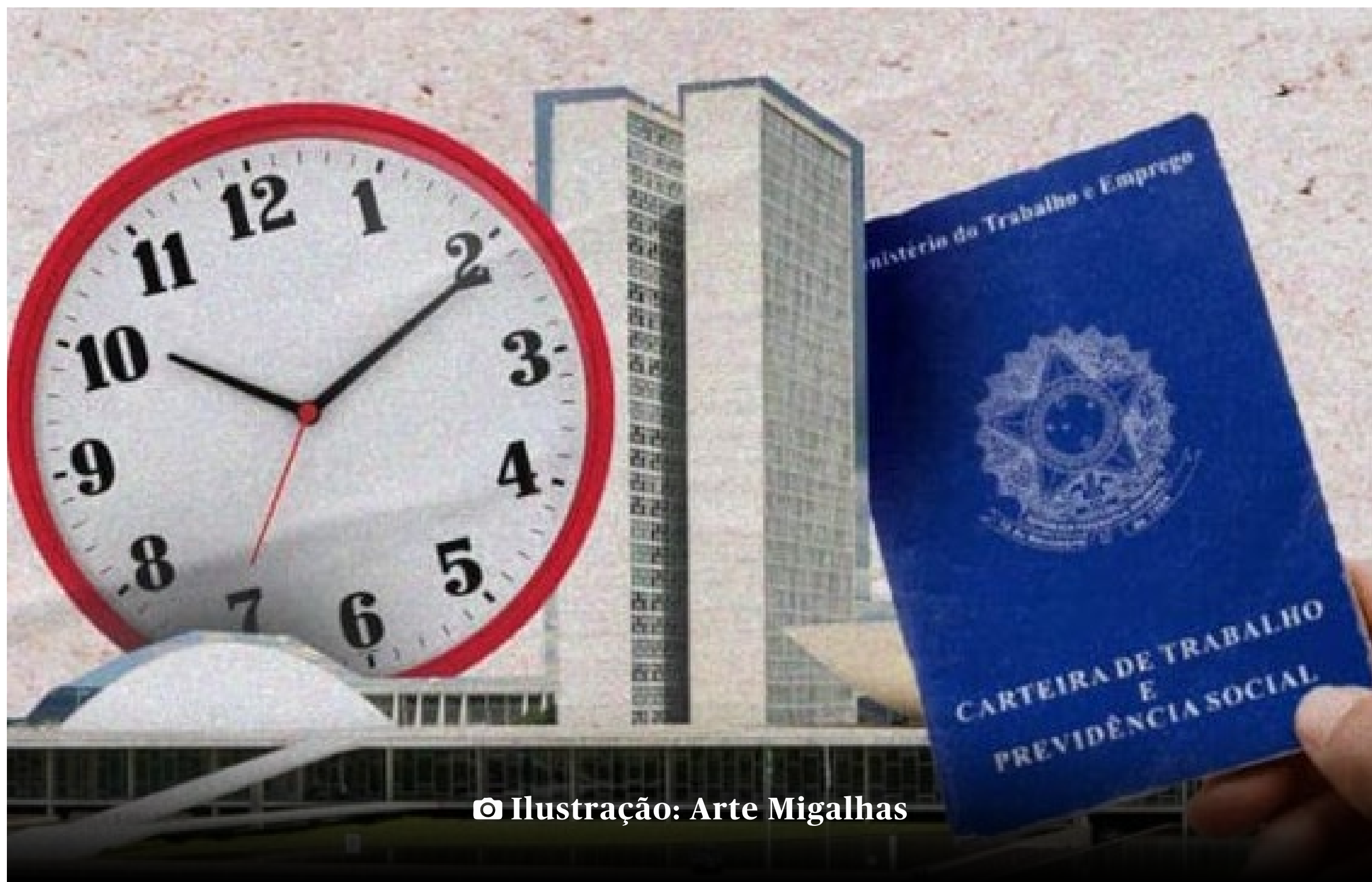
Ilustração: Arte Migalhas